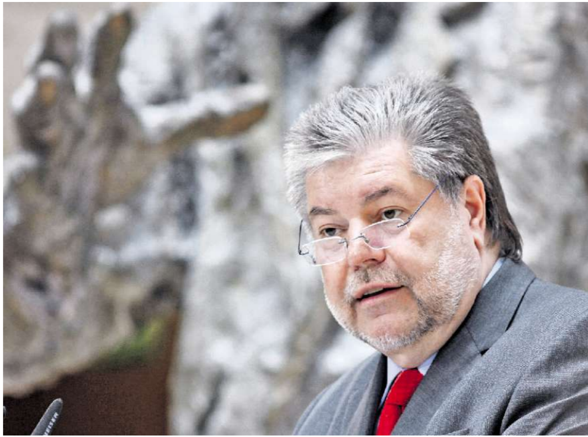
Immer für eine Überraschung gut: Kaum hatte die CSU ihr Steuerkonzept präsentiert, kündigte SPD-Chef Kurt Beck auch eines an.

Ähnlich war dies bislang auch im Willy-Brandt-Haus gesehen worden. Dort wurde der Zukunftskongress seit langem für eine programmatische Diskussion geplant. Beck hatte zu Ostern überraschend erklärt, bei dem Treffen in Nürnberg solle der Kurs im Umgang mit der Linkspartei diskutiert werden. Nun weckt er öffentliche Erwartungen auf ein Steuerkonzept. Bei dem Thema bestche in dieser Legislaturperiode „kein Handlungsbedarf“, hatte SPD-Generalsekretär Hubertus Heil noch am Montag erklärt: „Wir werden nicht auf Landtagswahlterminen ir-reale Debatten anfangen.“