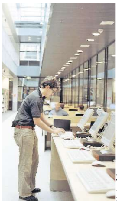
Uni-Bibliothek in Maastricht: Gute Studienbedingungen locken deutsche Studenten in die Niederlande.

Und als i-Tüpfelchen sind dann auch noch die Jobaussichten besonders rosig: 90 Prozent der Absolventen aus Maastricht finden innerhalb von drei Monaten einen Arbeitsplatz – das ist absolute europäische Spitze.